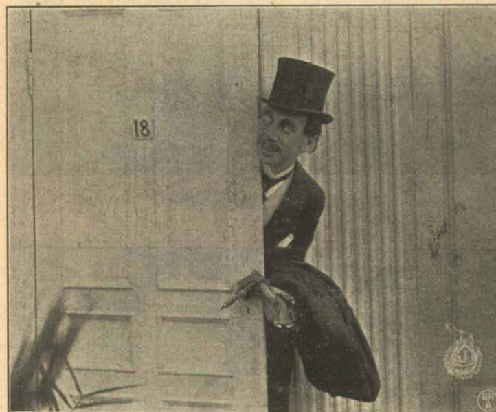
Det ominøse „Nr. 18“.

Imidlertid arbejder Tom Bruce med megen Energi paa at finde den mystiske Orientaler, han passer paa ved Jernbaner og Dampskibe, og en Dag ser han ved Damperen til Eksburg en orientalsk udseende Herre gaa ombord. Hoho — tænker Tom — her har vi Manden, og forsigtigt sniger han sig efter ham og passer ham op. Det varer heller ikke længe, før Tom bestyrkes i sin Mistanke.