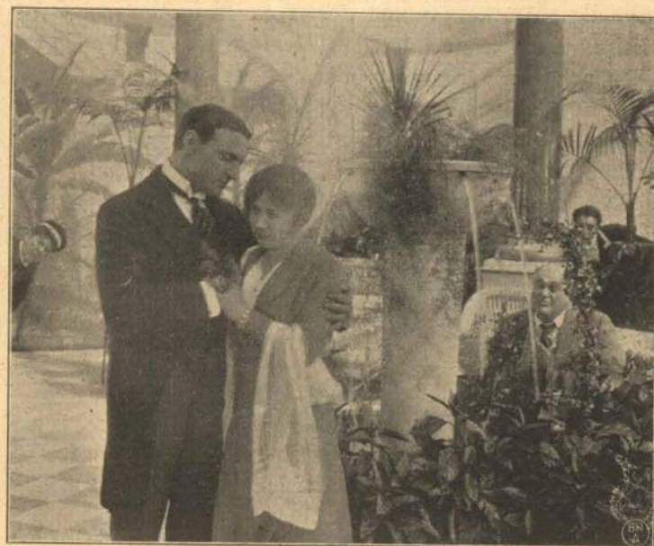
I Palmernes Skygge.