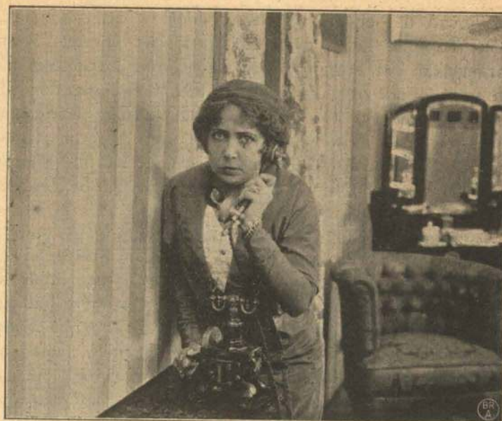
En vigtig Telefonsamtale.